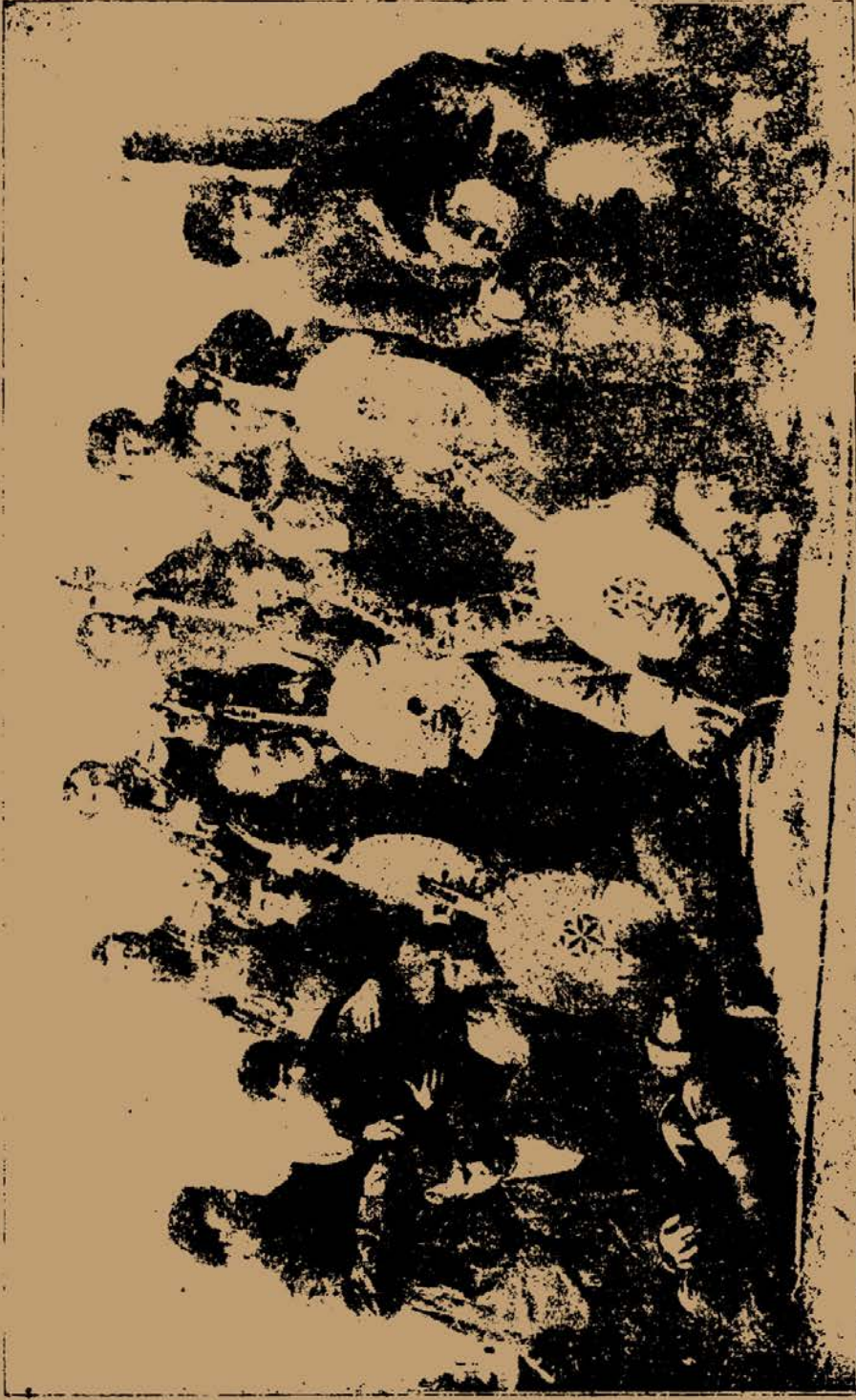
Група українських народніх музиків, що грали на археологічному з'їзді в Харкові 1902 р. Верхній ряд, від лівої руки: 1. Невідомий музик. 2. Арсен Остапенко („Мова“), майстер коба з с. Деркачів біля Харкова. 3. Іван Остапенко (брат Арсена). 4. Самсон Веселий, лірник. Середній ряд, від лівої руки: 1. Іван Зозуля, лірник з Вел. Данилівки, Харківськ. пов. 2. Петро Древиченко, кобзар з Залютина біля Харкова. 3. Терешко Пархоменко, кобзар з Бурківки, Черниг. пов. 4. Гнат Хоткевич, організатор з'їзду кобзарів. 5. Михайло Кравченко, кобзар з Бел. Сорочинців, Миргородськ. пов., Полтавськ. губ. 6. Павло Гащенко, кобзар з Харківськ. губ. 7. Даріон, невідомий лірник, Долішній ряд, від лівої руки: 1. Павло Кисіль, поводитатор Древиченна. 2. Іван Нетеса, кобзар із Старих Мерців, Валкс. пов. Харківськ. губ. 3. Іван Кучеренко, з Мурафи, Богодухівського пов., Харківської губ.